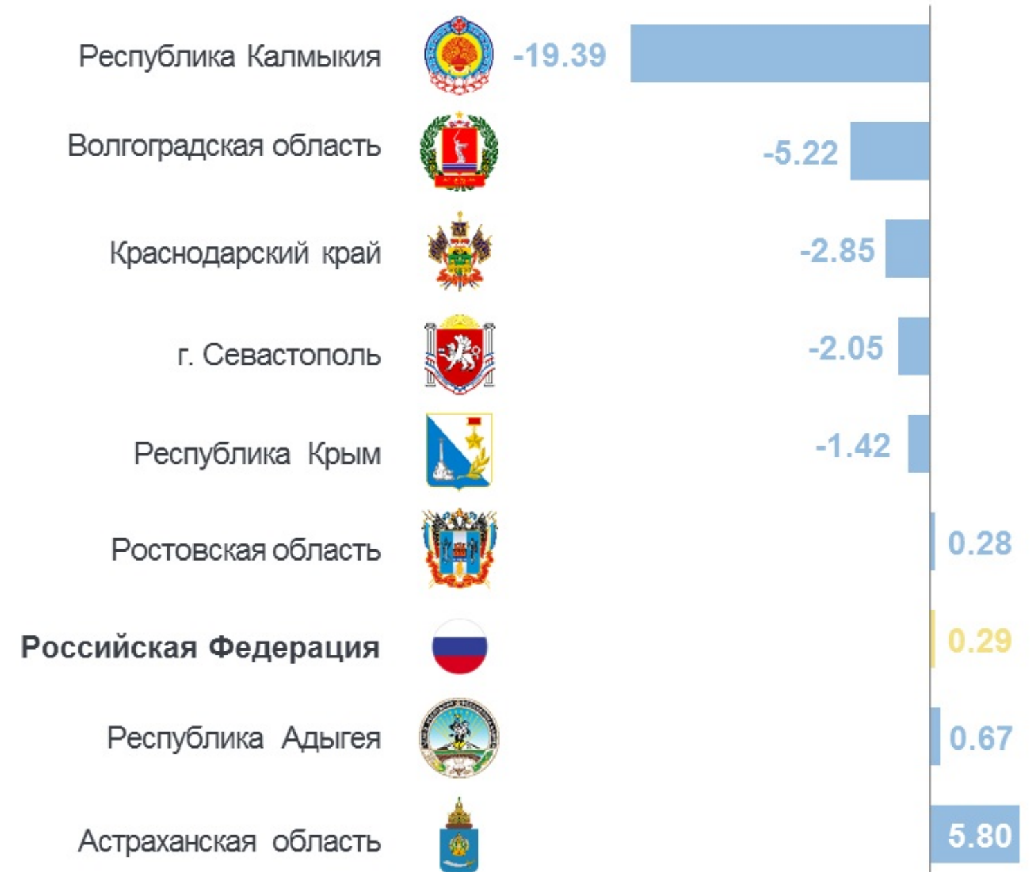
ИЗМЕНЕНИЕ СТОИМОСТИ ПО ЮФО, В % К 2022